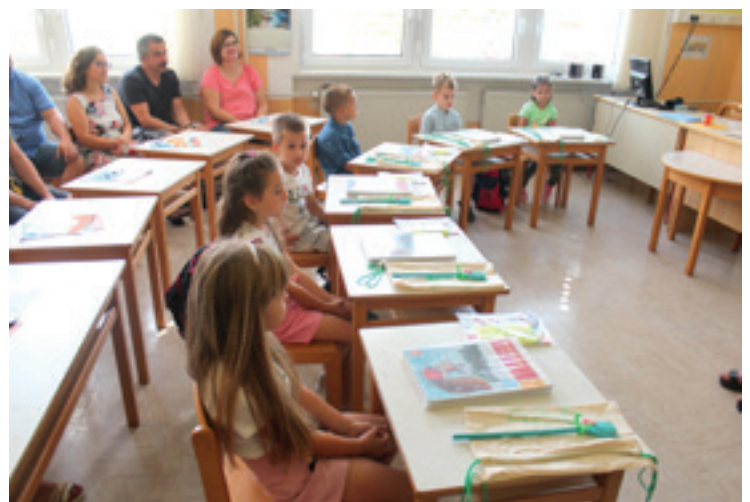
1.B POŠ Dokležovje