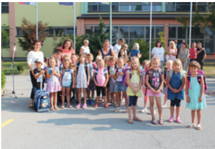
1. A OŠ Beltinci