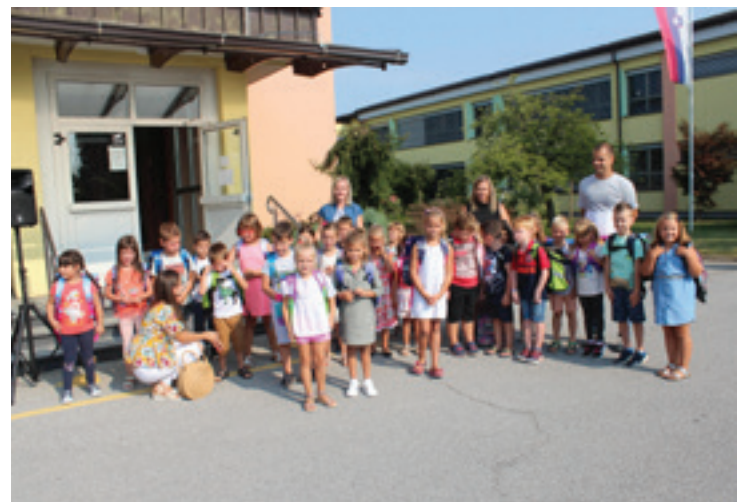
1. B OŠ Beltinci