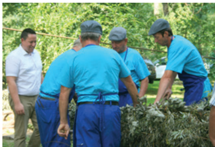
28. bujaški dnevi Ižakovci 2019 - Župan z bujaši