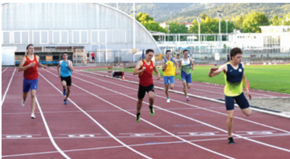
Tek na 400m

Na štartu je prva, za njo druga skupina tekmovalcev. Na vrsti je še