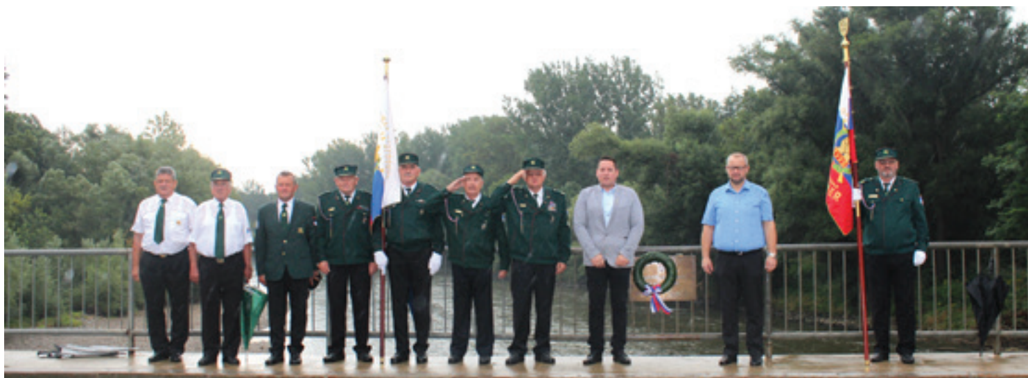
Položitev venca braniteljem samostojne Slovenije