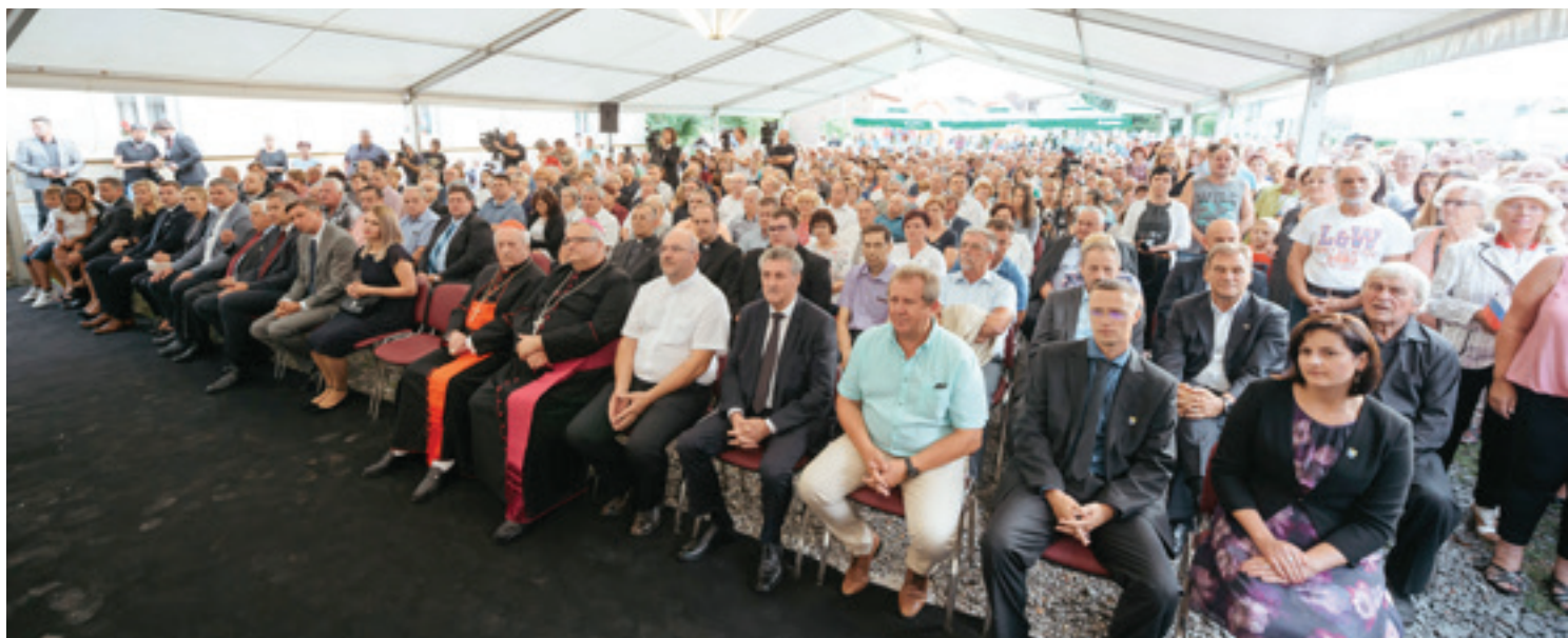
Visoki gosti na proslavi ob občinskem prazniku