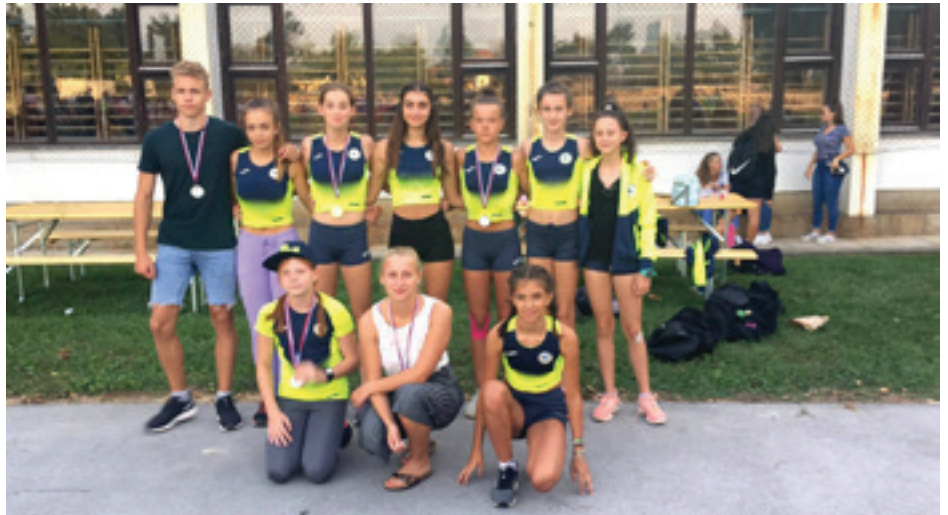
Dekleta društva Slopence na tekmovanju v Šentjerneju.