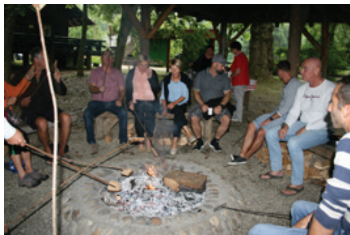
Projekt "Doživetje ponudbe Dežele štokelj", LAS Pri dobrih ljudeh 2020 - Dan odprtih vrat na Otoku ljubezni v Ižakovcih