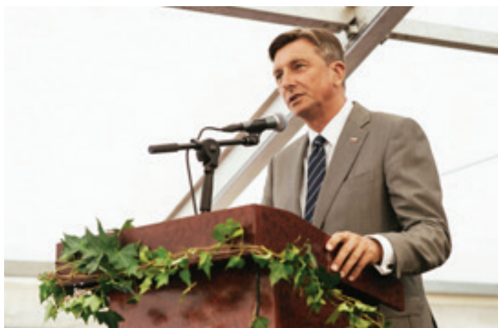
Predsednik Republike Slovenije g. Borut Pahor, slavnostni govornik na osrednji proslavi ob občinskem prazniku