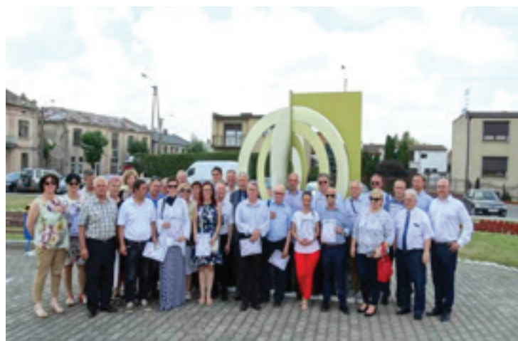
Delegacija Občine Beltinci na Poljskem, junij 2019