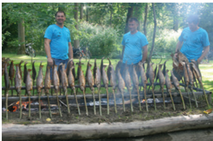
28. bujaški dnevi Ižakovci 2019 - Ribe na bati