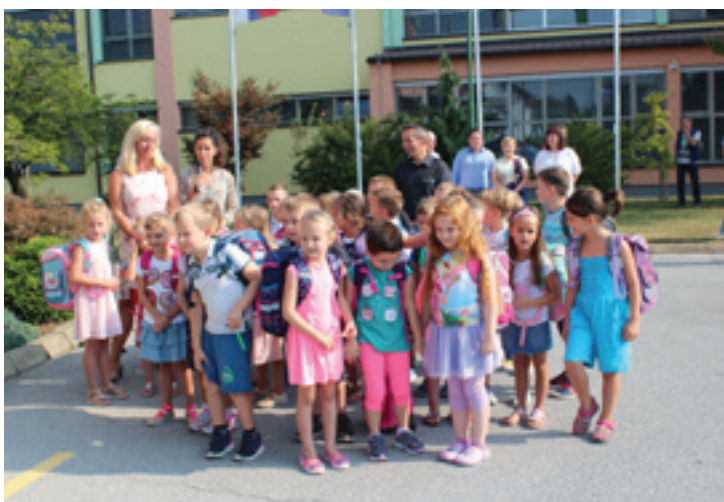
1. C OŠ Beltinci